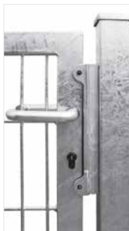
Aluminiumschlag / -klappen, Drücker rund

Wir liefern unsere Tore komplett verpackt mit zur Montage erforderlichen Zubehörteilen und Zaunanschlüssen.