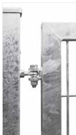
Augenschrauben M12 mit geschweißter Fische